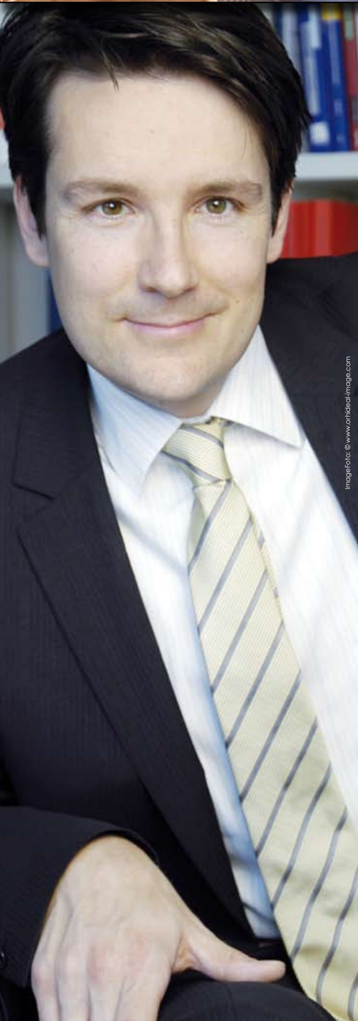
ImageFoto: @ www.orthidial-image.com